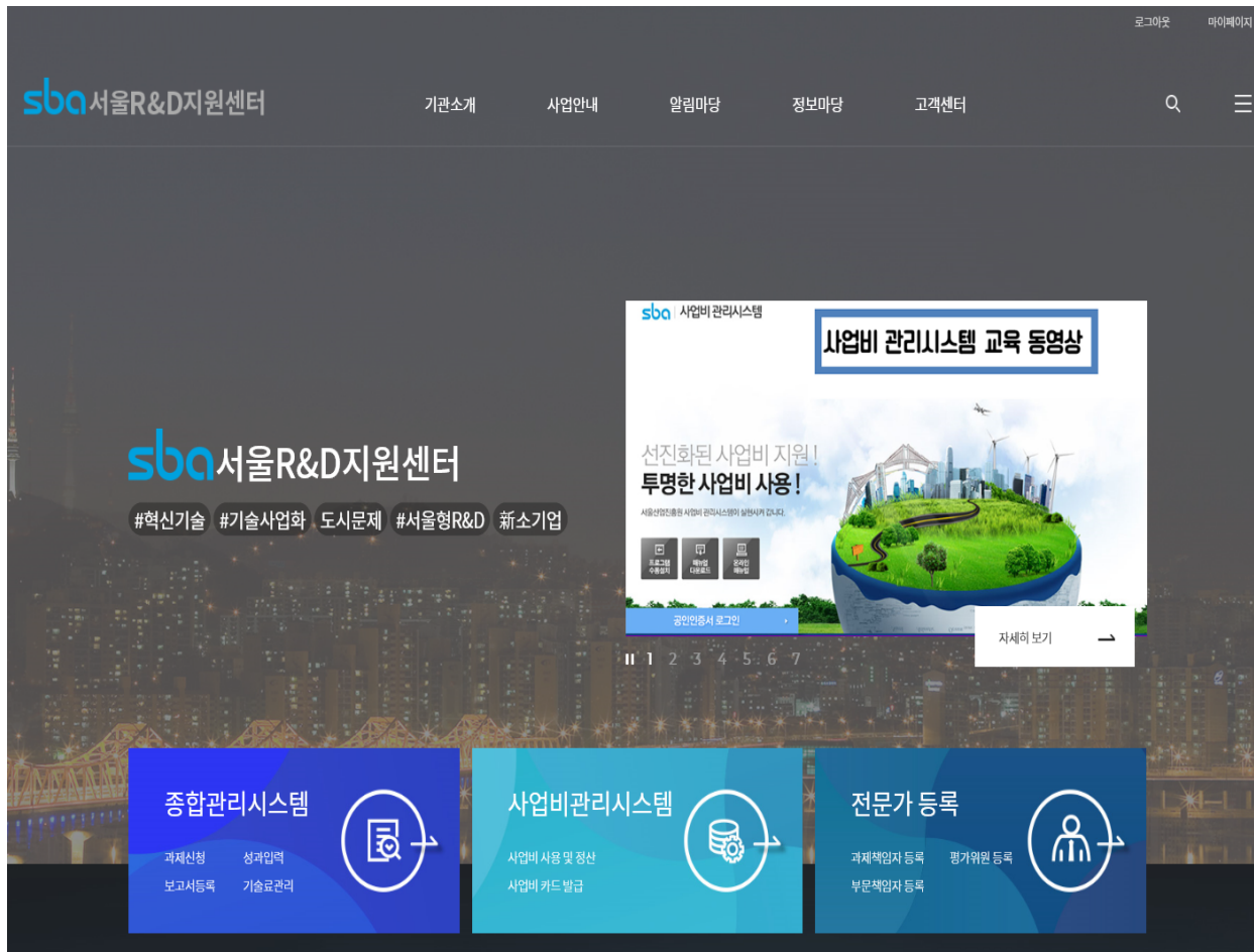
① 산학연협력사업 홈페이지 로그인

[ 산학연협력사업 홈페이지 ( http://seoul.rnbd.kr ) ]